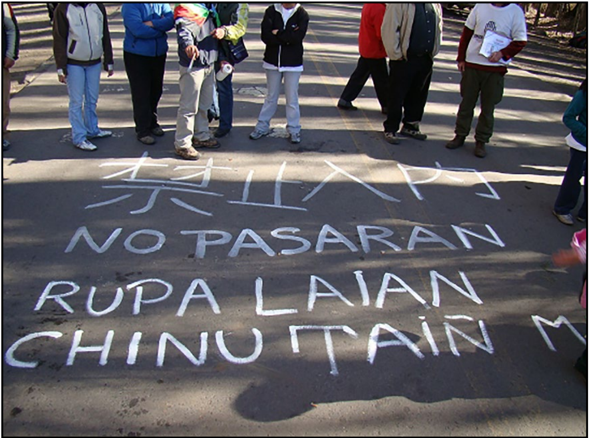
Figura 2. Pintada en camino de acceso a Loncopué: “no pasarán” en chino, español y lengua mapuche. Loncopué, septiembre de 2009.

mineros (especialmente a los funcionarios del gobierno). Mellao Morales realizó paralelamente otra demora informativa, en un camino alternativo que pasa por su territorio, y en este acceso sufrió la demora el intendente de Loncopué. Hubo personas procesadas judicialmente por esta acción, la mayoría de ellas pertenecientes a la comunidad Mellao Morales.