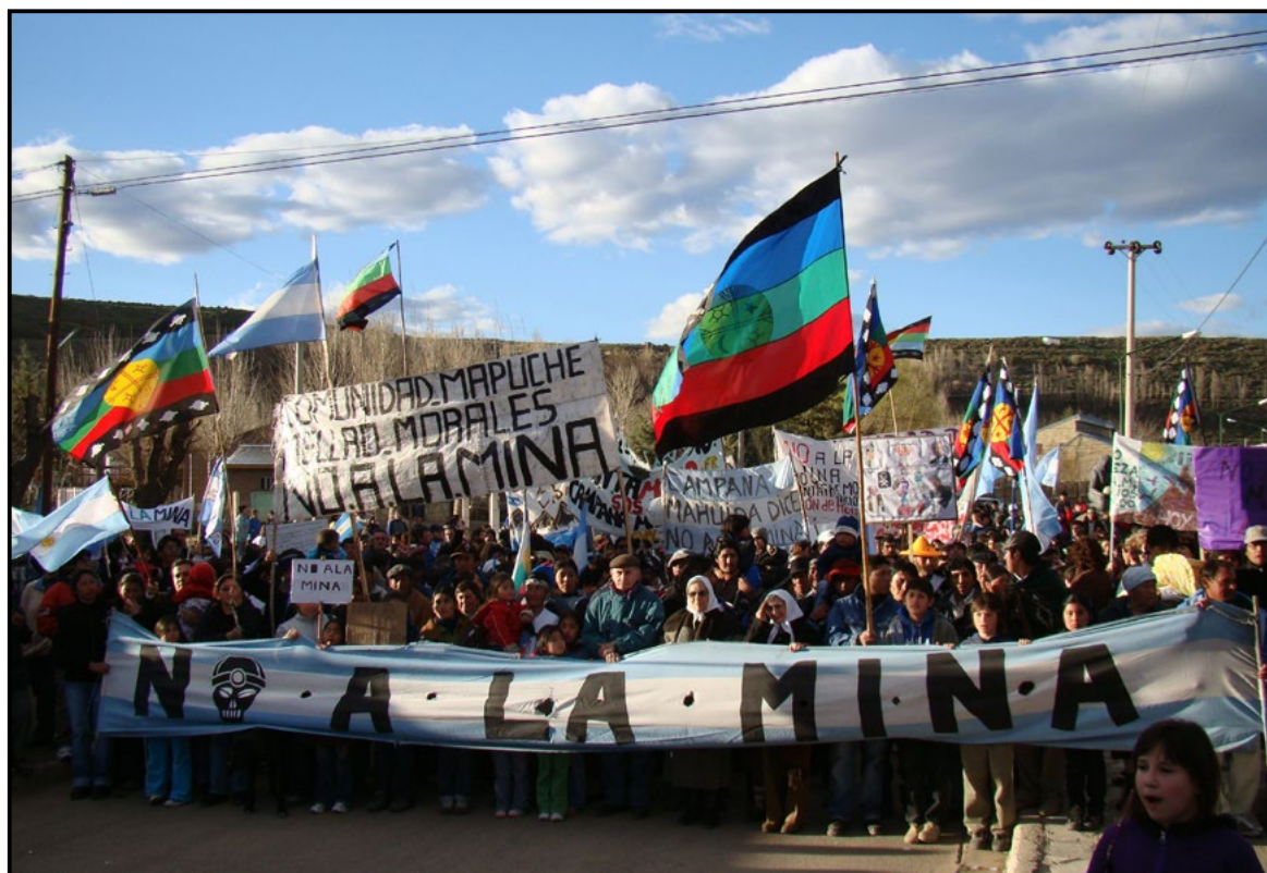
Figura 3. Movilización festejando la Resolución del TSJ de Neuquén, que suspendió el proyecto minero. Loncopué, 29 de septiembre de 2009.

En Loncopué, la población estaba esperando las novedades en el puente de acceso a la localidad. Cuando recibieron la noticia de la decisión del Tribunal, un mayor número de pobladores se concentró en el puente, y marcharon hasta la Intendencia manifestando su alegría por la caída del proyecto minero.