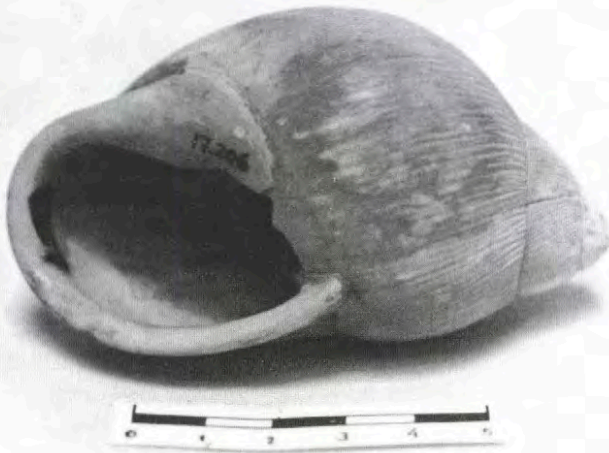
Foto 1 Sthrophocheilus oblongus müll reg. 17206. Colección del IIAM.