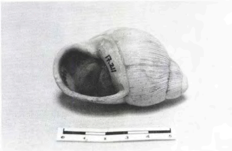
Foto 3 Ejemplares de Sthrophocheilus oblongus müll portando lana impregnada con colorante ocre. Colección del IIAM.