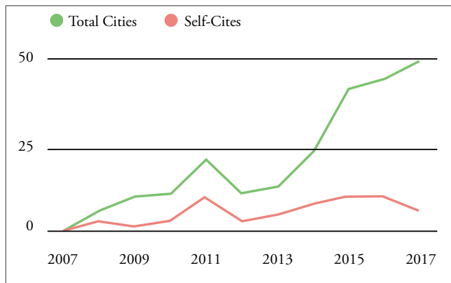
Figura 2. Total de citas.