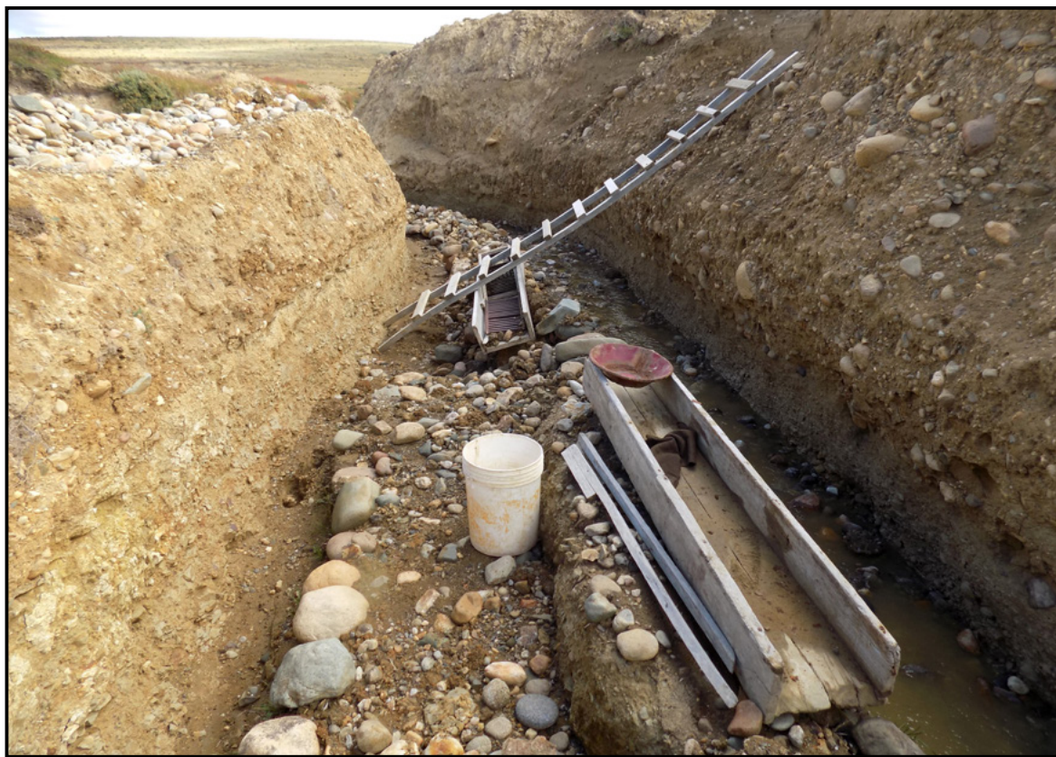
Figura 2. Herramientas de extracción aurífera en cordón Baquedano.