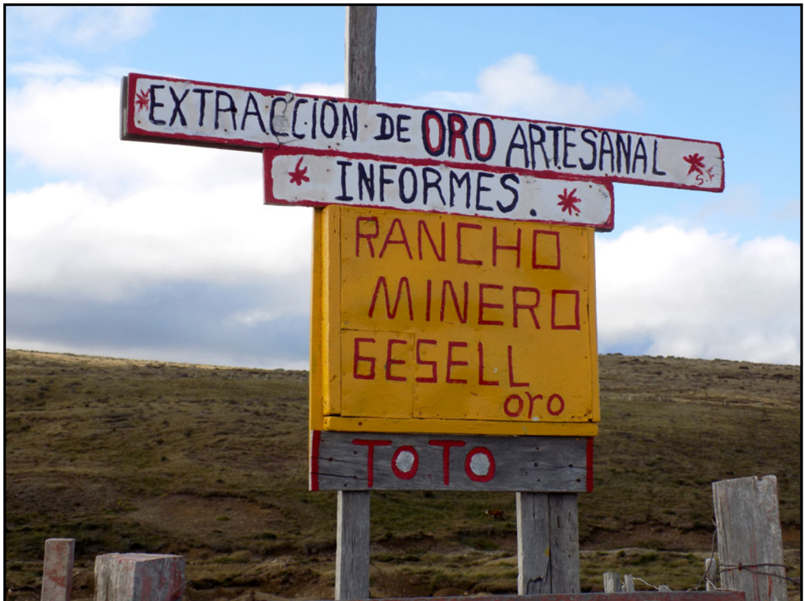
Figura 5. Rancho de charpa (minero).

precio del oro ha mejorado considerablemente: “el gramo en joyerías de Punta Arenas está en 20.000 pesos. La última cifra que logré obtener fueron 160 g, que equivalen a 3 millones”. 60 [...] Las joyerías han sido uno de los principales espacios de circulación de la mercancía y su valor de uso y cambio (venta de oro) es ambivalente, especialmente en ciudades chilenas como Punta Arenas, pero también en lugares de Argentina como Río Grande y Ushuaia.