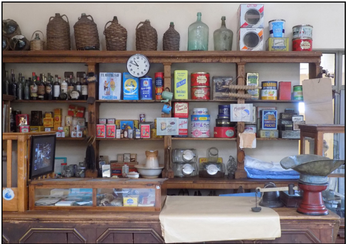
Figura 4. Almacén Esteban Vukasovic, Porvenir (1893-1993).

esquila. Considerando la invisibilidad del mercado aurífero y el colapso de mano de obra en las estancias, el reparto de tierras que concedía el gobierno terminó por desencantar el retorno a la minería, provocando nuevos intereses como la agricultura.